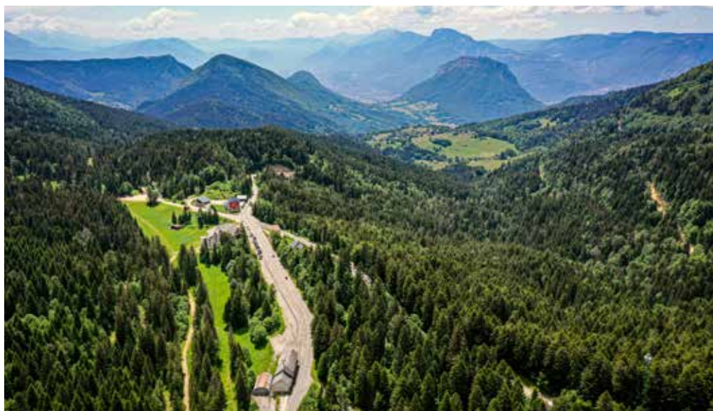
Vue aérienne sur le site du col de Porte